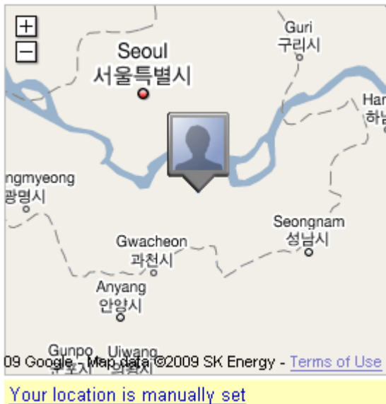
(그림 2) 구글의 Latitude

구글 역시 모바일 SNS 에 관심을 가지고 2007년 Jaiku 를 인수하였다. Jaiku 는 사용자의 위치 정보와 현재 상황을 업데이트 하는 마이크로 블로그 서비스로 웹과 모바일에 특화되어 있다. 향후 안드로이드 플랫폼과의 시너지를 가지며 발전해 나갈 것으로 기대되고 있다. 최근에 서비스를 개시한 Latitude 역시 위치 기반의 SNS 로 모바일과의 연계성을 강조하였다.